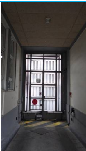
Rez de chaussée / Portail métal accès Cour Nord (84 rue des Pyrénées)