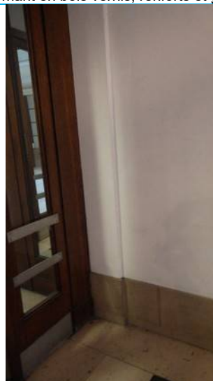
Rez de chaussée / 1 er bloc porte accès Hall d'entrée Mur Droit et tableau de porte Droit : peinture et enduit sur pierre