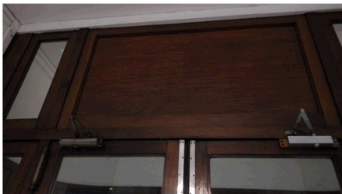
Rez de chaussée / 1 er bloc porte accès Hall d'entrée Linteau de porte plâtré et peinture