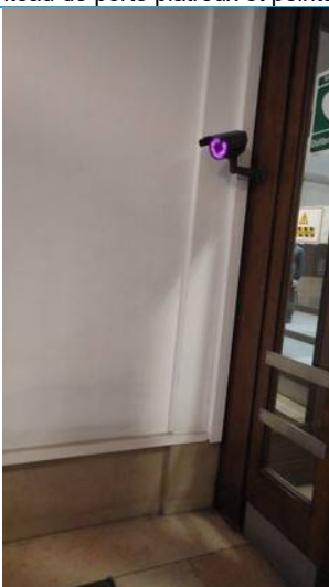
Rez de chaussée / 1 er bloc porte accès Hall d'entrée Mur Gauche et tableau de porte Gauche : peinture et enduit sur pierre