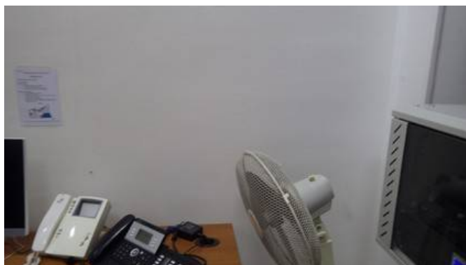
Rez de chaussée / Bureau R08 Mur Droit : Peinture, toile de verre et enduit sur pierre